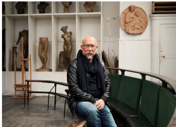
艺术家张恩利，K11 Art Foundation ( KAF ) 与英国皇家艺术研究院 ( Royal Academy of Arts ) “艺术家驻留交换项目”。

KAF与英国皇家艺术研究院的合作将持续3年，包括中国当代艺术家在英国皇家艺术研究院驻留创作和研究院所甄选出的艺术家回访驻留两部分组成，驻留项目将进一步孵化中国当代艺术与文化的软实力。今年正值英国皇家艺术研究院成立250周年，“艺术家驻留交换项目”将成为系列庆祝活动的重要一环。而该项目本身在重要的国际艺术平台上强化了当代中国艺术与文化的自信，更为国际文化学术交流创造了全新平台，增强中国年轻一代的文化认同。