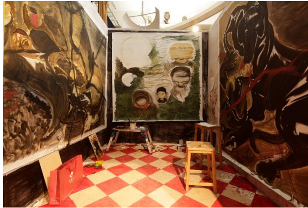
“恩利工作室”，K11 Art Foundation (KAF) 与英国皇家艺术研究院 (Royal Academy of Arts) “艺术家驻留交换项目”。